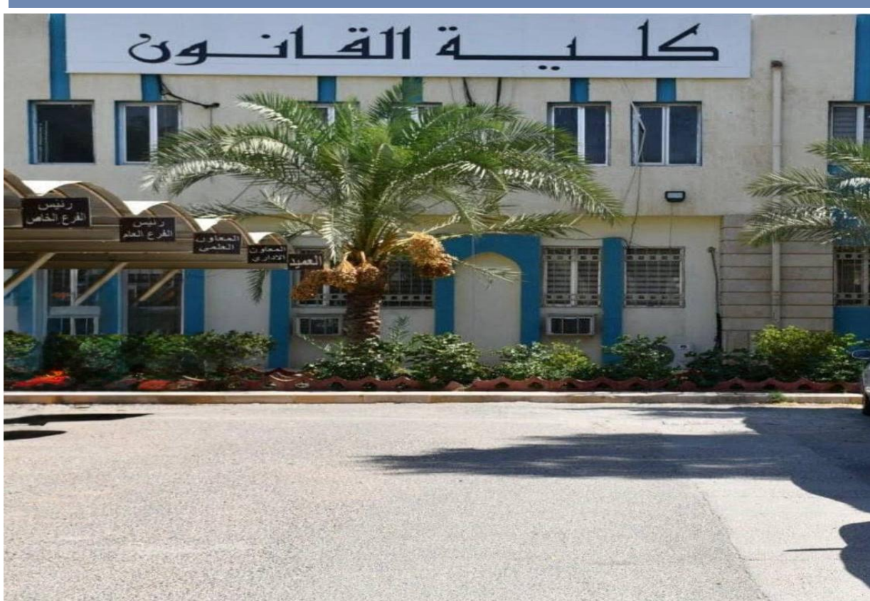
Table of Contents | جدول المحتويات